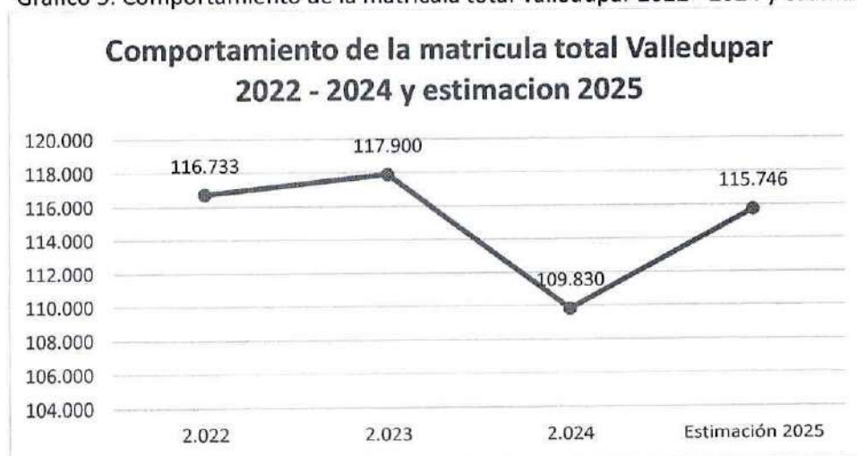
Gráfico 5. Comportamiento de la matrícula total Valledupar 2022 - 2024 y estimación 2025

Durante el año 2023, tanto la matrícula oficial, contratada y la no oficial disminuyeron. Sin embargo, se espera que en el futuro aumenten, dado que, actualmente la secretaría de educación está implementando una estrategia de búsqueda activa llamada "Todos al Aula" con el objetivo de que aproximadamente 5.000 niños, niñas y adolescentes ingresen al sistema educativo para el año 2025.