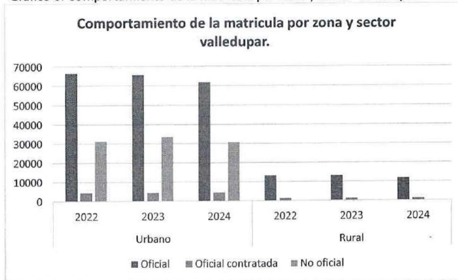
Gráfico 6. Comportamiento de la matrícula por zona y sector Valledupar.

Por otra parte, en la zona rural la matrícula oficial ascendió a 11.718 alumnos significando una disminución de 1.432 alumnos en comparación con el año anterior. Así mismo, la matrícula oficial contratada no presentó una variación significativa, registrando 1.183 alumnos para la vigencia en mención.